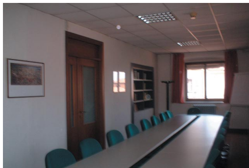
Sala del Centro Analisi dei Simboli e delle Istituzioni Politiche

Nota Bene: Lo studente può anticipare al II anno insegnamenti del III anno e posticipare al III anno insegnamenti del II