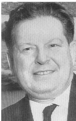
Bruno Leoni: Preside dal 1948 al 1960. Fondatore della rivista "Il Politico"

Disdetta della seduta di laurea: in caso di mancata partecipazione alla seduta di laurea, lo studente ha l'obbligo di informare la Segreteria Studenti nella stessa mattinata prevista quale termine per la consegna della tesi.