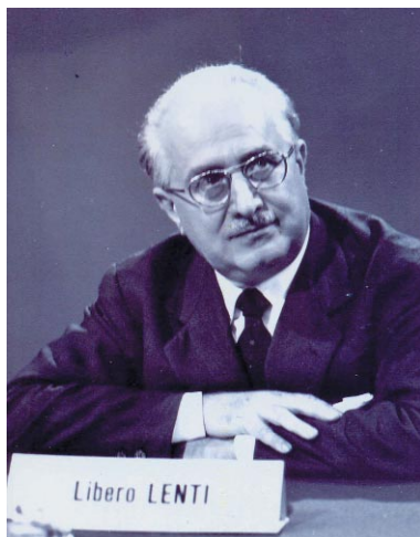
Libero Lenti Professore di Statistica dal 1939 al 1960