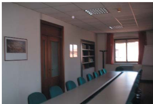
Sala del Centro Analisi dei Simboli e delle Istituzioni Politiche "Mario Stoppino"