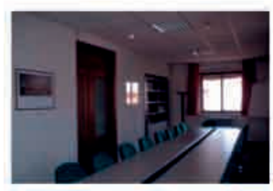
Sala del Centro Analisi dei Simboli e delle Istituzioni Politiche "Mario Stoppino"